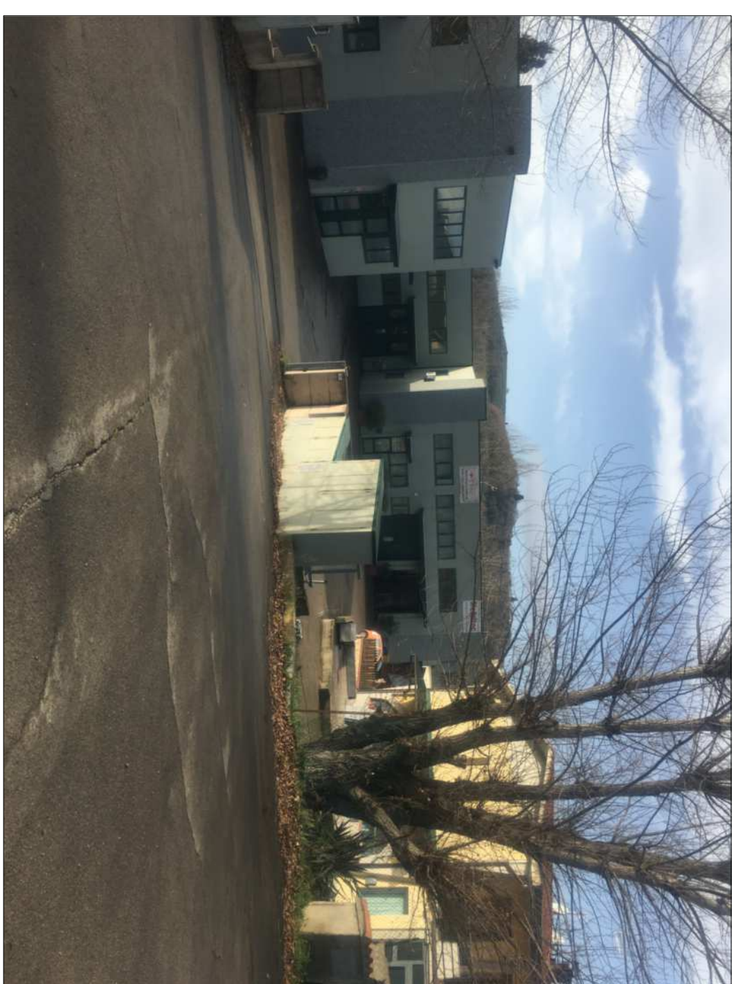
VEDUTE FRONTE ANTERIORE